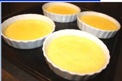
映画「アメリ」のクレームブリュレ

近隣駐車場： 小田急OX万福寺店の駐車場 お食事4000円以上で1時間 キャッシュバック！