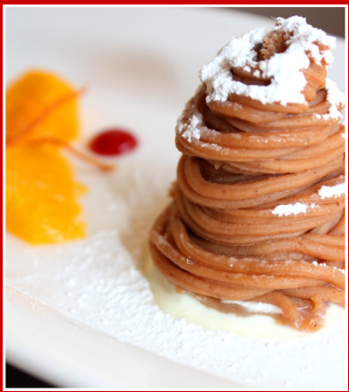
フランス産栗をたっぷり! 使った 大人気のモンブラン!