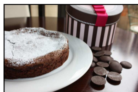
(写真の箱は、別物です)