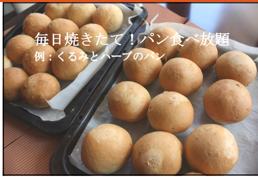
毎日焼きたて!パン食べ放題 例:くるみとハーブのパン

毎日焼きたてパン&地元野菜をふんだんに使った料理 安全な食材を厳選し一つ一つ丁寧に作り上げた料理