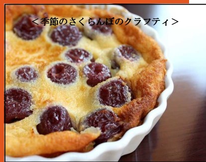
<季節のさくらんぼのクラブティ>