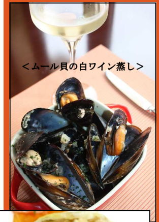
<ムール貝の白ワイン蒸し>